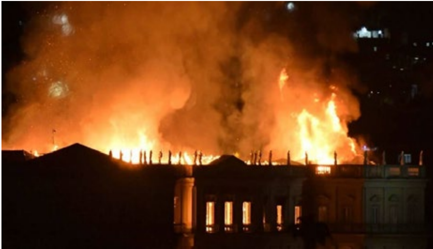
Modelo Diamond BL X-Treme Fire: Protección contra el fuego