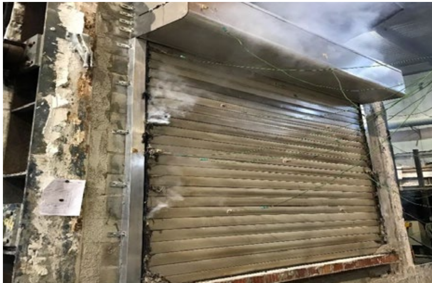
Modelo Diamond BL X-Treme Fire: Resultado test fire tras 84 minutos