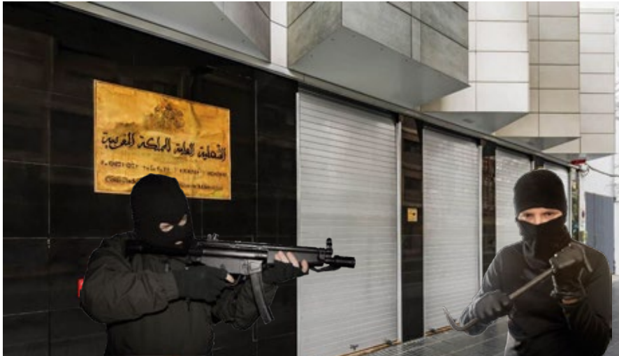
Modelo Diamond BL: Embajada Marruecos