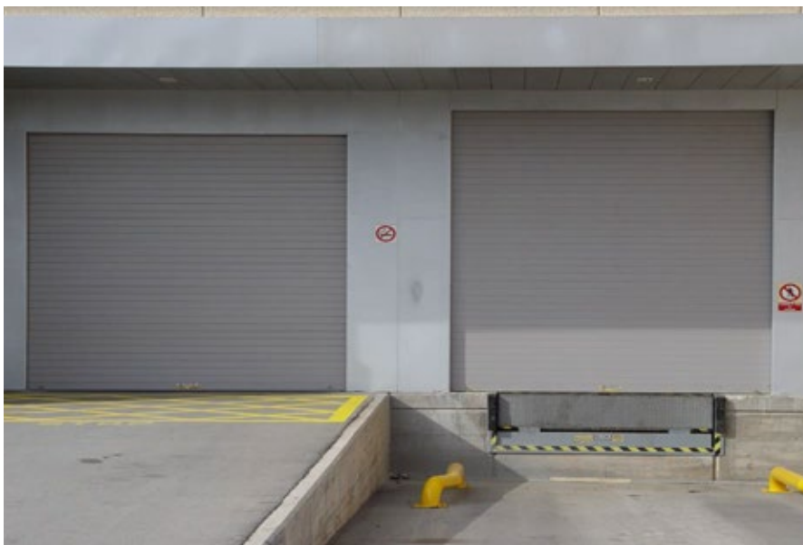
Modelo Diamond BL: Área de carga